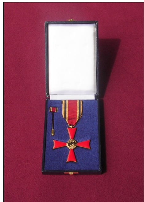
Bundesverdienstkreuz am Bande